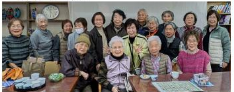
みんなと一緒に ハイ、にっこり😊