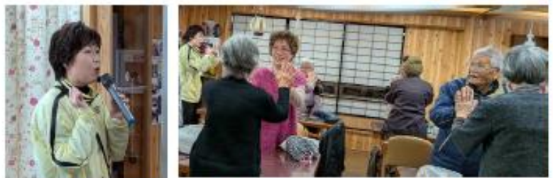
多久和さんのトークと楽しいプログラムで、時間が経つのがあっという間でした。